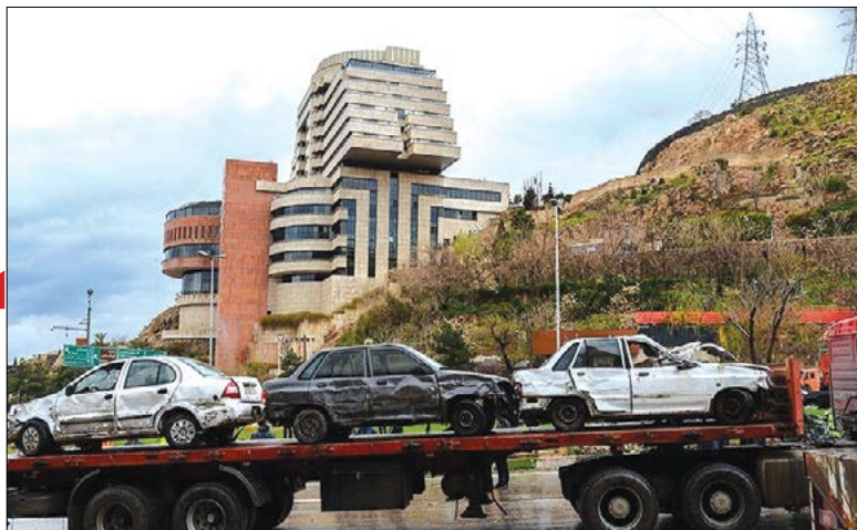
رایگان تعمیر شده است.